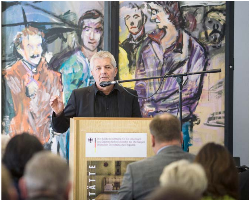
Roland Jahn bei der Eröffnung einer Stasi-Ausstellung in Dresden

Gleichwohl sprechen sich die Koalitionsfraktionen für einen Transformationsprozess aus. Die Behörde solle gemeinsam mit dem Bundesarchiv ein Konzept für die Zusammenfüh-