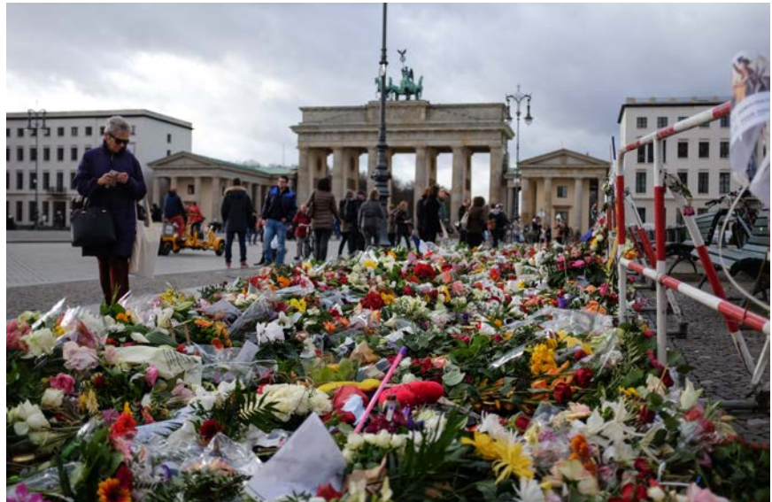
Trauerbekundungen nach den Terroranschlägen von Paris

Zudem seien die Erkenntnisse über Terroristen national oft vorhanden, jedoch könnten andere europäische Staaten nicht darauf zugreifen, kritisierte der Unions-Innenpolitiker Clemens Binninger: „Wenn Attentäter in